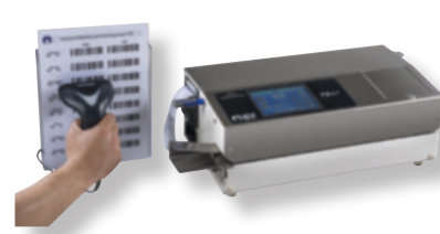
Soudreuse TS 47T avec SCAN et options USB et AUTOTEST