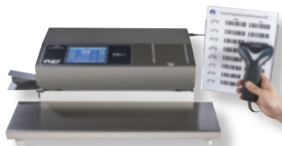
Soudreuse TS 47T avec SCAN et support lisse inox