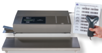
Soudreuse TS 47 avec option SCAN