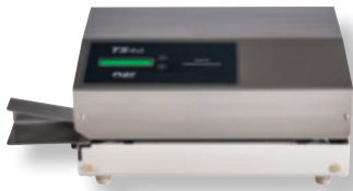
Soudreuse TS 46