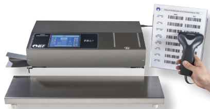
Soudreuse TS 47T avec SCAN et support lisse inox