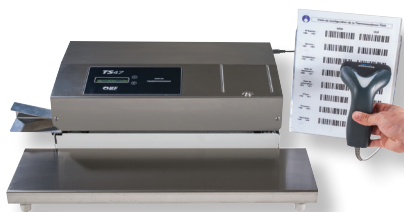
Soudreuse TS 47 avec option SCAN