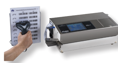
Soudreuse TS 47T avec SCAN et options USB et AUTOTEST