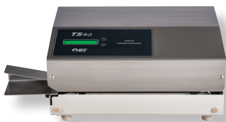
Soudreuse TS 46